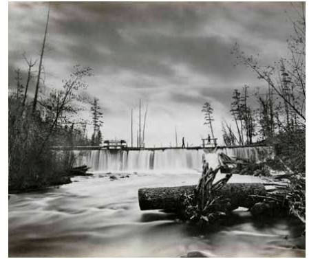
Alexander Henderson, Barrage régulateur, rivière Blanche, près de Derry, Ontario, vers 1866. MP-0000.267.1