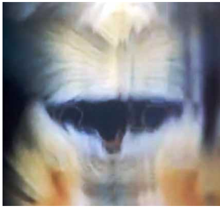
From My House To Yours