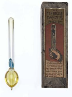
Jouet The Demon Dancer 1890-1910 Verre, mélange de liquides volatils M996X.2.424.1-2