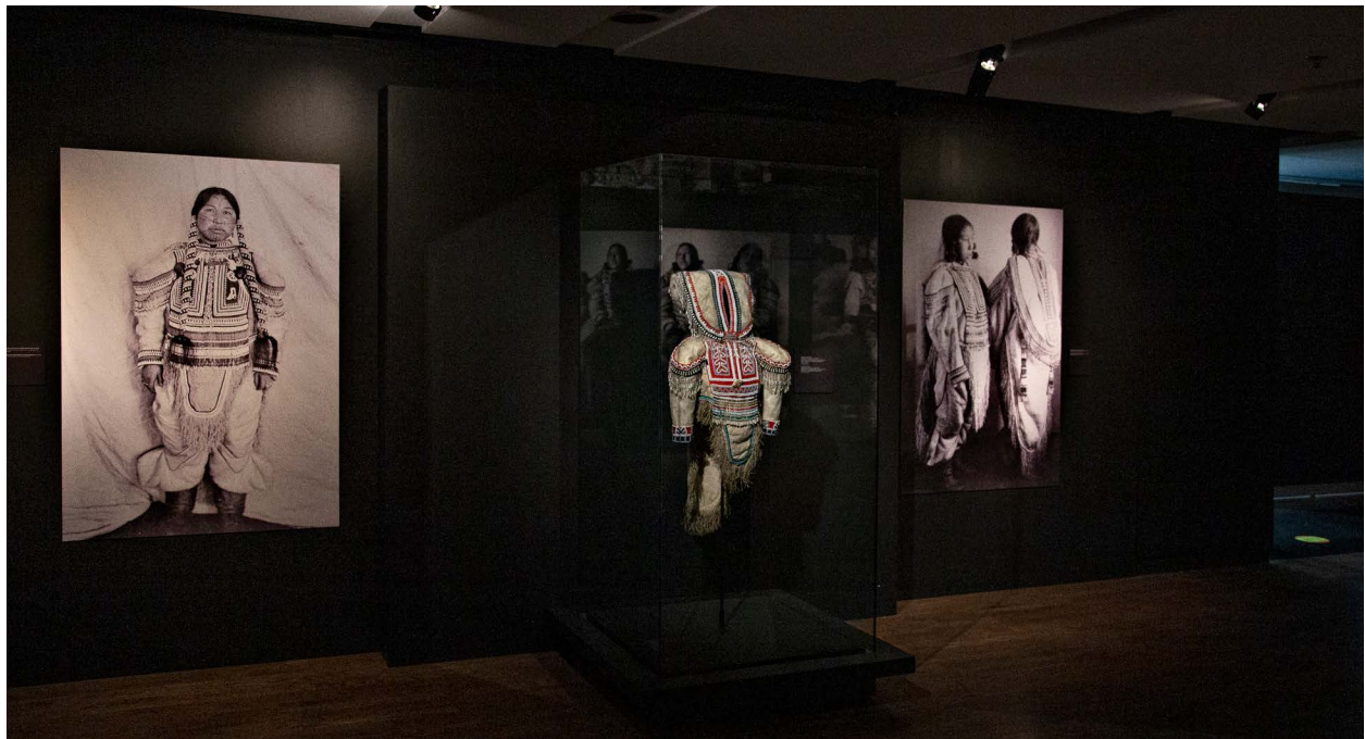
© Roger Aziz – Musée McCord