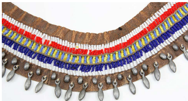
Ornement d'amauti, Inuit, Nunavimut?, 1900-1930 Don de Air Canada, M999.105.4

Places limitées, réservation obligatoire.