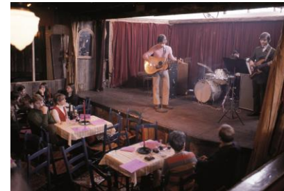
Spectacle de Claude Gauthier à La Bute à Mathieu Juin 1969

Divisée en six zones distinctes, l'exposition propose une véritable immersion dans la trame sonore du Québec.