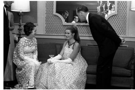
Madame Drapeau dans une robe de Michel Robichaud et la princesse Grace de Monaco 1967